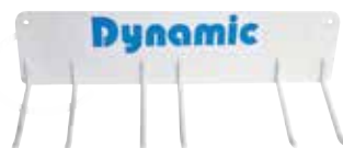
Support mural inclu