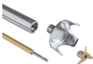
Pied et cloche entièrement démontables