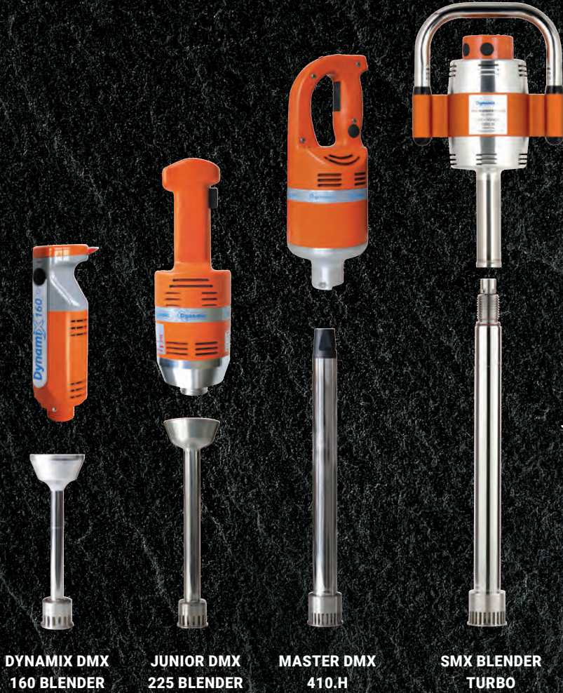
Gama desmontable pie blender

La sociedad DYNAMIC les propone soluciones ideales para triturar sus mix helados y jarabes destinados a sorbetes. Soluciones que les acompañaran durante años. Se recomienda nuestra gama de trituradores para homogeneizar un helado y obtener la consistencia/textura ideal.